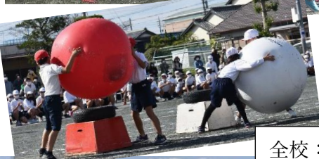
全校:力を合わせてワッショイ大玉