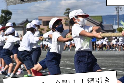
4年:パワー全開!!綱引き