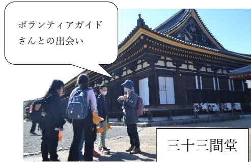
ボランティアガイドさんとの出会い