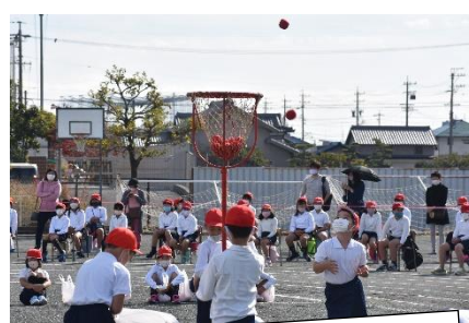
2年:八球勝負 玉リンピック