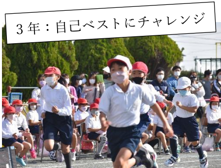
3年:自己ベストにチャレンジ