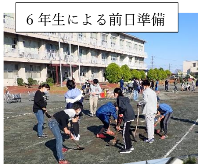
6年生による前日準備