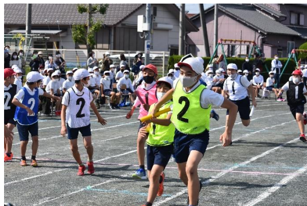
【運動会6年：キズナでつなげ！ 全員リレー】

11月も、下記のような学校・学年の行事を計画しています。感染がさらに落ち着き、予定通り実施できることを願っております。